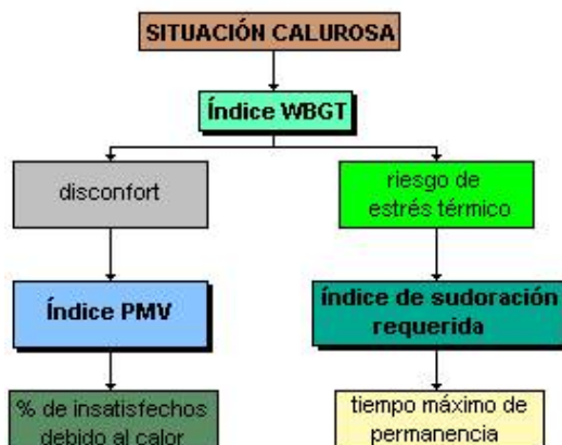
Fig. 1: Índices de valoración de ambiente térmico

Existen diversos métodos para valorar el ambiente térmico en sus diferentes grados de agresividad.